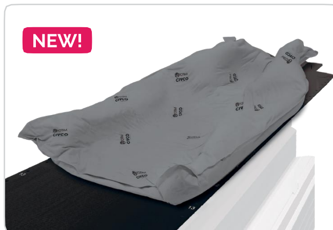
Size: 70 x 110 cm, Large Body

TOTIM - полностью закрытая подушка, покрытая полиэфиром из микрофибры. Подушка формируется вокруг пациента после активации внутренних компонентов. Она сохраняет свою форму на всех сеансах лучевой терапии.