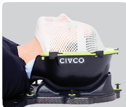
Шаг в 5 (нейтральный)