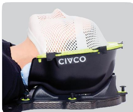
Шаг в 0 (подбородок)