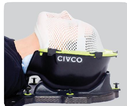
Шаг в 10 (подбородок вверх)